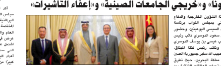
مجلس النواب العربي

نواب يناقشون مع السفير الصيني مستجدات «كورونا» و«خريجي الجامعات الصينية» و«إعفاء التأشيرات»