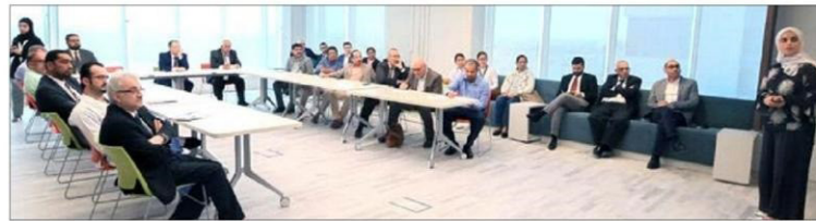
■ Representatives at the meeting