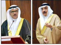
سماء عبدالجليل مجلس الوزراء

أكد وزير العمل والشؤون الاجتماعية جميل حبيدان أن عدد الأفراد والأسر البحرينية الواقعة تحت الحد الأدنى لمتطلبات الحياة الأساسية والمستقيمين من المساعدات الاجتماعية يبلغ 17209، جاء ذلك في معرض رده على سؤال النائب الدكتور عبيدالله النوداي حول عدد الأفراد والأسر البحرينية الواقعة تحت الحد الأدنى لمتطلبات الحياة الأساسية.